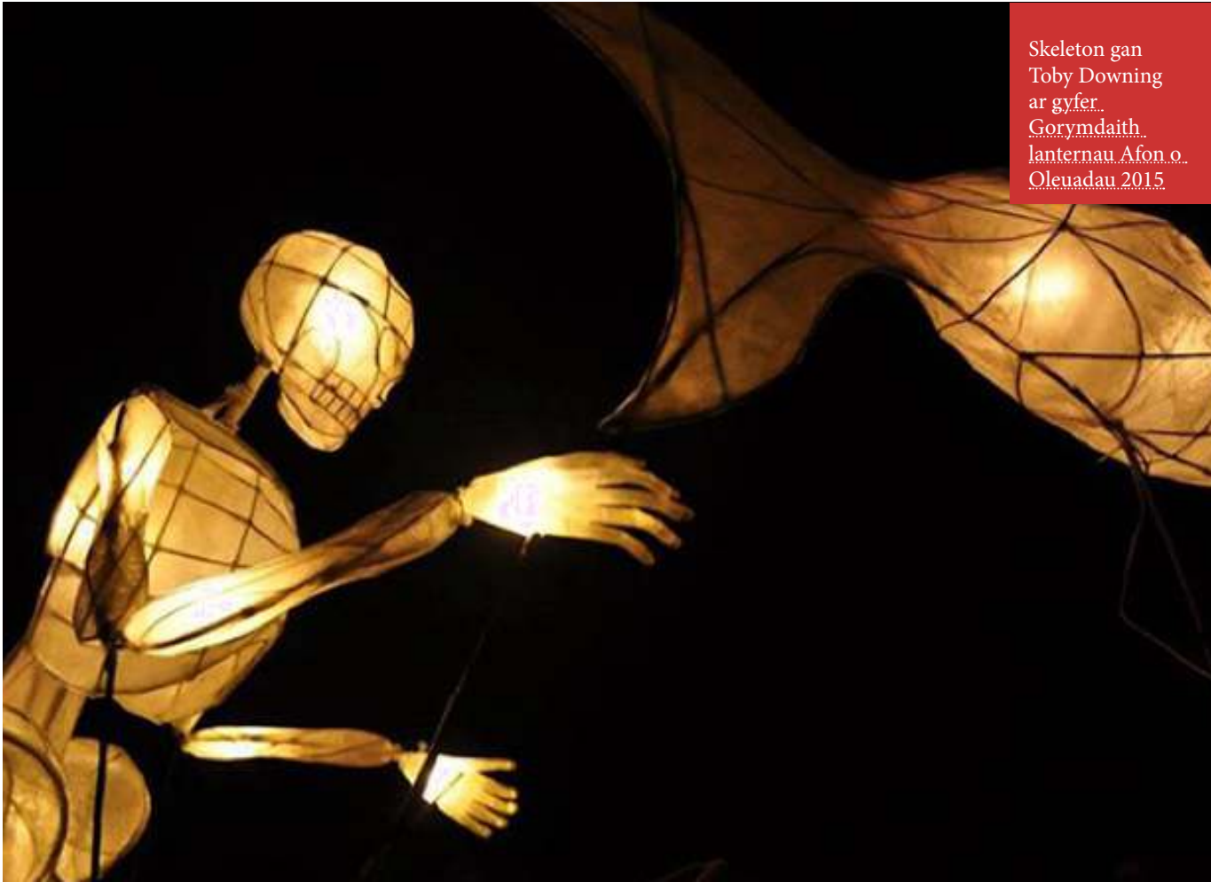
Skeleton gan Toby Downing ar gyfer Gorymdaith lanternau Afon o Oleuadau 2015

Yn ystod y cyfnod peilot a thrwy gydol y flwyddyn gyntaf, gwahoddwyd pobl i fynegi eu barn er mwyn creu astudiaeth llinell sylfaen i fesur y newid dros amser.